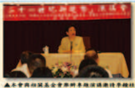
▲本會與相關基金會舉辦專題演講邀請李教授博士會主講