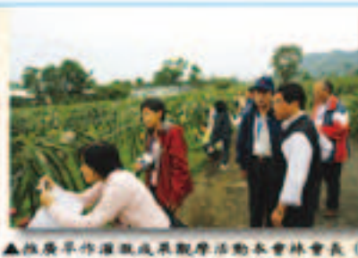
▲推廣旱作灌溉成果觀摩活動本會林會長(戴帽者)聽取花蓮農田水利會林會長(穿背心者)說明三農共構農具、旱作噴灌設施優質均佳