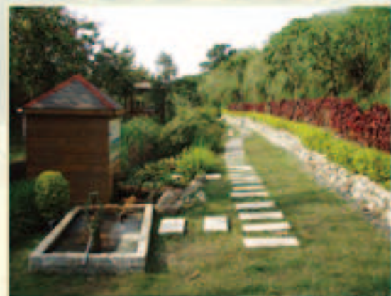
▲社子島松風善水綠圳道

往北行至洲美橋下，進入四二抽水站旁著名的當地景點—北興宮，主祀神祇為吳王爺—保應出外人著名的廟宇，這是社子居民的重要信仰中心，可在此祈求保佑萬事順利身家平安；再往前行回到社子花卉廣場，園區內有園藝美食童玩與DIY創作，「花園田坊」有各色美麗的盆栽花草，有無需天天澆水的仙人掌，小巧可愛鮮豔多款，蘭花區清香撲鼻花香處處，環肥燕瘦各展花形，讓您看得眼花撩亂，目不暇給；逛完後可轉往藝術工坊，那裡有古樸刻意的陶器，各種用途的成品，盆飾、花瓶、水杯，破盤到純藝術創作應有盡有，也可DIY個性的水杯，拼貼出專屬的杯墊，捏成可愛的雙人相框，累了，一旁買點下午茶，濃濃茶香配上甜點，但見滿園花卉搖曳，微風中淡淡花香的甜味，讓您身心舒暢；餓了！阿媽的菜店裡的東坡肉，翠玉養生捲、四季豆軟絲……等等美食佳餚正等著您去品嚐呢！