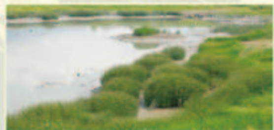
▲社子島河灘地營造生態池植草埔

淡水河與基隆河於50年代尚可行駛吃水4噸重的汽船，當時延平北路七段水肥處第一隊的載肥船沿著水道到大稻埕等人口聚集地收集家庭水肥，運回社子作為蔬菜專業區的肥料，臨江園就是水肥隊的棧橋。