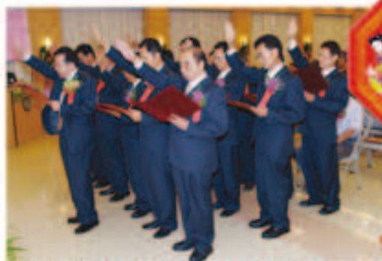
▲本會第2屆直選會長會務委員就職典禮連任林會長與15位新任會務委員宣誓就職

本會是一個具有光輝歷史的水利會，個人很榮幸將一生歲月奉獻於茲，50年前從基層做起，一步一腳印，並蒙各位長官、先進指導、栽培、同仁們協助、配合，堅定我一路走來效法瑤公無私奉獻精神的信念，為瑤公志業打拼，並以身為「瑤公人」為榮，四年前，復承大家讚賞及會員們支持，忝任本會第1任直選會長，四年來帶領同仁兢兢業業推展會務，無論在配合政府推動「三生」新農業運動、落實會員服務、擴大事業領域、強化工作團隊、加強灌排維護、健全財務管理、從事社會公益等各個工作層面，幸無負會員及各位所托，都獲得良好的績效，尤其今年行政院農業委員會遴選個人為績優會長，於全國水利節大會接受隆重表揚，這是