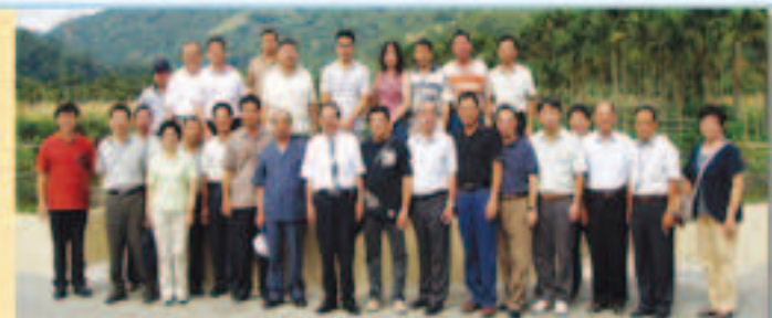
▲林會長(前排打領帶者)暨會內同仁陪同全體會務委員視察本會的埤林，設立「芬園灌溉示範區」推廣旱作灌溉成果合影