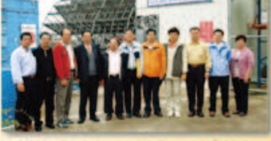
▲本會辦理員工在職訓練觀摩定開田水利會「萬長春圳川流式水利發電站」運作情形林會長(左四)與同仁合影