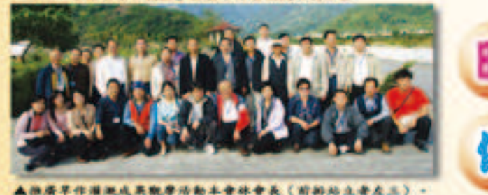
▲推廣旱作灌溉成果觀摩活動本會林會長(前排站左者左三)、會務委員、駐室主管在台東農田水利會林會長(前排站左者左二)引導下參觀卑南大圳水利公園後合影