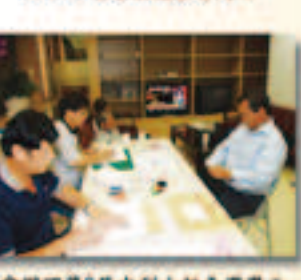
▲本會辦理第5屆水利小組長選舉工作會員洽辦各項小組長登記事宜