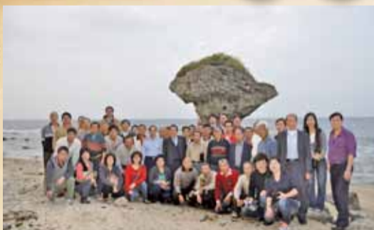
▲2月29至3月2日舉行水利小組國內觀摩活動-南台灣知性之旅，圖為會長與全體水利小組長、班長於小琉球花瓶石美景前留影。