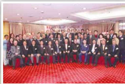
▲本會與日本茨城縣取手市岡堰土地改良區締結姊妹會十週年，日本姐妹會蒞訪受到熱烈歡迎。

本會除了結合相關基金會，推動社會服務工作外，並積極配合協助台灣農村經濟學會、科學農業社、淡江大學及農業工程研究中心等相關學術研究單位，辦理多項有關農業科技等多方面的調查研究工作計畫，期能協助推動我國農業之整體發展。