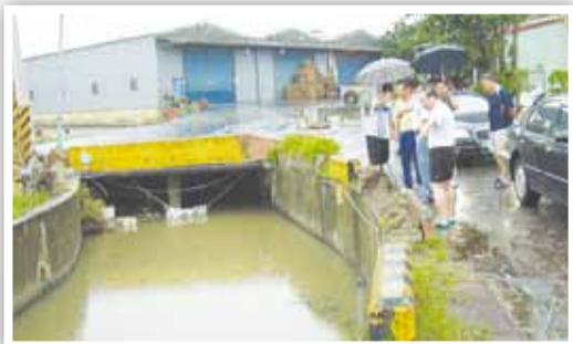
▲颱風後，林會長率同仁巡視社子地區圳道受損情形。

逐項以「目標管理」精神重新訂定，避免浮編；在預算執行上力求專款專用，避免流用與浪費，在經費核銷上強化勾稽事宜，務期適當與適度使用經費；年度結餘撥入會有「固定資產建設基金」，除持續推動各項社會公益服務工作外，餘款將作為永續推動、發展本會會務工作之用。