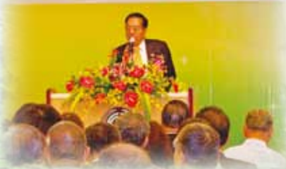
▲會長主持 101 年水利節暨錫瑠環境綠化基金會成立 20 周年慶祝大會。