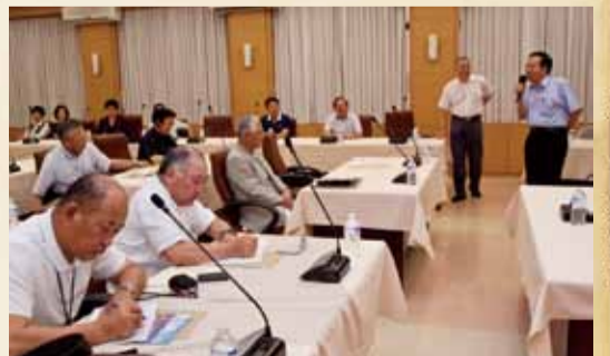
▲6月14日日本新潟縣龜田鄉土地改良區五十嵐理事率同理事5人蒞訪，會長致歡迎詞並簡報。