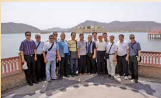
▲4月12至18日，會長（左七）率同會務委員赴印度進行觀摩活動，上圖是以16世紀印度拉賈斯坦君主所挖掘之人工湖上營建「水之宮殿」，為背景合影。