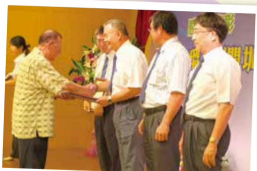
▲周前會長清標頒獎嘉勉本會表現績優同仁。