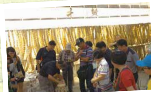
▲5月5至6日舉辦自強活動參訪台南仁德區十鼓文創園區。