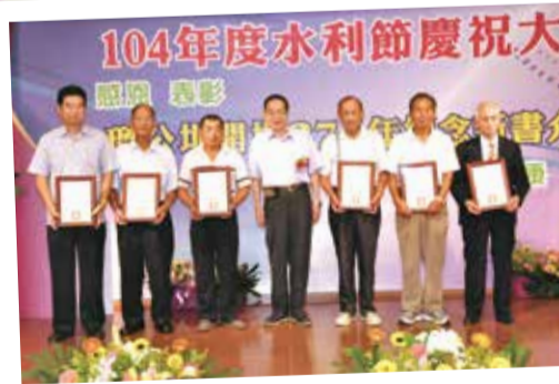
▲林前會長頒獎資深績優水利小組組長。