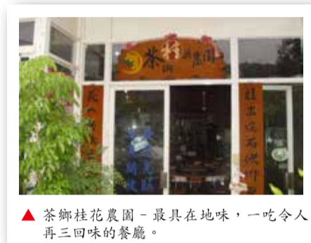
▲茶鄉桂花農園－最具在地味，一吃令人再三回味的餐廳。