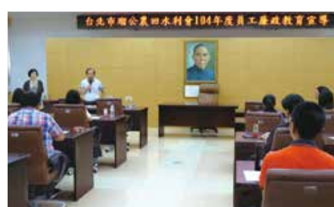
▲6月16日會長主持104年度員工廉政教育宣導活動。