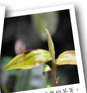
▲小綠葉蟬叮咬後的茶菁。

東方美人茶是因茶葉被小綠葉蟬（ Jacobiasca formosana ）叮咬後，茶菁製成茶葉時帶有特殊的花果蜜香，而且有蟲害代表農藥使用量少，有助於健康茶葉的推廣。