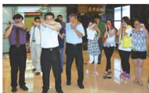
▲6月4日上午辦理地震防災避難引導演練等講習課程，圖為學員模擬在地震發生火災之逃生動作。