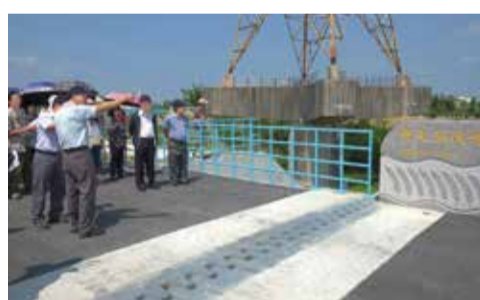
▲4月27至29日舉辦員工在職訓練，會長暨同仁在嘉南農田水利會人員解說下，觀摩新近完工南幹線跨越曾文溪渡槽改建工程。