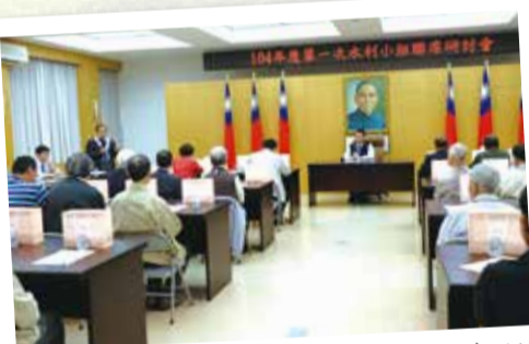
▲3月16日舉行104年度第一次水利小組聯席研討會，會長於會中致詞。