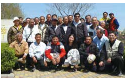
▲4月15至22日舉辦水利小組第一梯次觀摩考察活動，參訪青島市城陽區近郊之棘洪灘水庫。