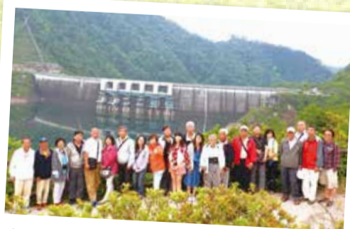
▲5月10至16日舉辦水利小組第二梯次觀摩考察活動，參觀日本第二大拱形水庫—溫井水庫。