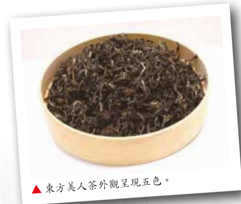
▲東方美人茶外觀呈現五色。

它又名白毫烏龍茶，因其茶芽白毫顯著，茶湯味醇甘滑，加上獨特熟果香與蜂蜜香，是台灣相當珍貴的茶種，它也是目前發酵濃度最重的飲品，平均的發酵度為60%以上。