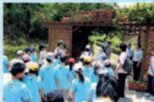
▲本會人員指引「2009水田生態兒童體驗營」學生參觀社子綠美化成果