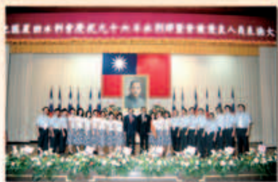
▲97年會長聯誼——海生館

農田水利事業是農業生產之必要手段，攸關農糧生產、農民收益及生態環境平衡的維繫，更是農村社會經濟安定的磐石。雖然社會經濟結構轉變，惟國家安全糧食仍須確保，農田灌溉重任仍然存在。聯合會今後當秉持著促進農田水利會互助合作、共同發展之宗旨，為農田水利會爭取最高福祉與利益，戮力充實內涵、研發業務項目、創新工作方法，務必使農田水利事業邁向管理科學化、設施現代化、組織強化、財源多元化、業務電氣化、人力年輕化的境界。