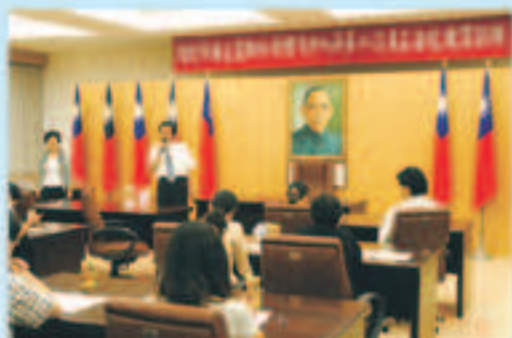
▲林會長主持98年度第二次員工法紀教育訓練