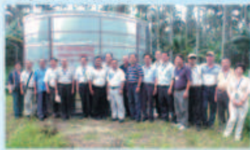
▲會長(左六)與會務委員訪視本會補助嘉義阿里山鄉農戶購置旱作灌溉相關設備