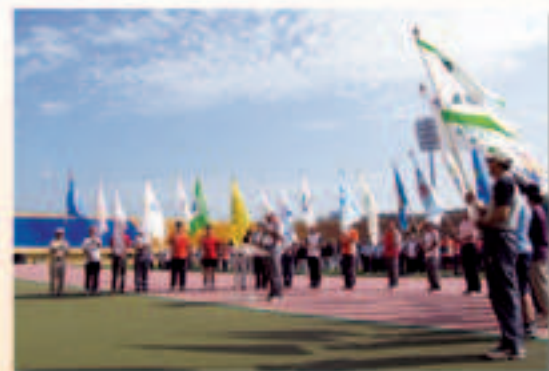
▲97年水利杯宣誓合照

鹽除了是調味的必備品之外，對於清潔器皿也有一套功效。例如：以鹽水來擦拭使用已有一段時日的瓷器或玻璃器皿將使表面光亮如新。若是新器皿可將之與鹽水一起和煮，便可以減少因端盛熱湯而破裂的機會。在清洗容易褪色的衣物之前不妨先以鹽水浸泡一下，將可減少褪色。而以蔬果洗潔劑洗淨後的水果，若再以鹽水浸泡，可去除表面的殘餘物，確保食用的安全，亦可增加水果的耐度呢！