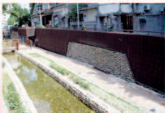
▲現階段施工改善成果-2

近年來大家生活富裕，開始重視周遭的生活品質及環境保護，除了希望能獲得更多的綠地系統與開放空間外，與水親近的嚮往又被重新點燃。因此臺北縣政府城鄉發展局針對新店市瑠公圳之圳道，進行整體景觀面貌改善，要賦予瑠公圳新的生命。目前已於96年6月開始進行第一期「臺北縣新店市瑠公圳圳頭及圳道景觀工程」，預計97年5月完工。且本計畫基地緊鄰捷運新店站及碧潭風景區，屬於新店市碧潭風景區入口空間，目前臺北縣政府高灘處「大碧潭再造」計畫，是臺北縣長周錫偉4大旗艦計畫之一，希望藉由碧潭與新店溪河邊的開發，帶動觀光人潮，吸引外來人口移入。