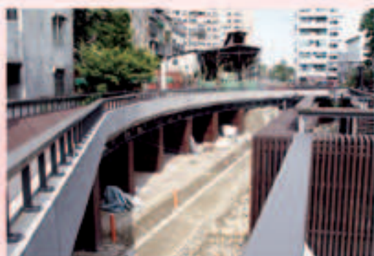
▲現階段施工改善成果-3

本案辦理變更都市計畫變更之基地範圍，正位於歷史圳道——「瑠公圳」源頭。圳路由碧潭圳頭經大坪林地區跨越景美溪流入臺北市，為當時臺北盆地主要的農田水利命脈，於民國七十三年一月結束了圳路所荷負的灌溉機能並走入歷史。