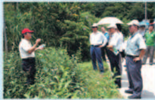
▲台北市政府辦理年度業務檢查官員赴本會事業轄區——坪林訪查旱作灌溉作業