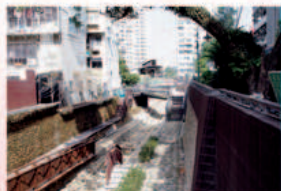
▲現階段施工改善成果-4

在環境方面，以瑠公圳水路發展的歷程做為開放空間開發與發展的方向，串聯原有圳頭美化與圳道空間改造，使其水岸住宅的意象與作為能由碧潭延伸到新店住宅中心區，串聯碧潭、瑠公圳沿線水岸空間，讓觀光資源藉此做數倍的擴充與增長效益。