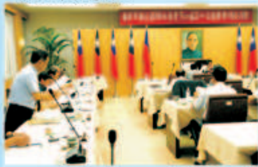
▲舉行第二屆第二次臨時會務委員會