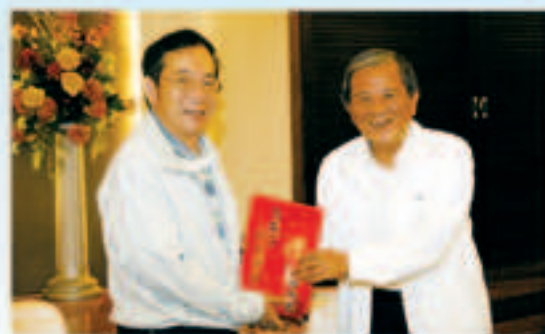
▲舉辦員工在職訓練赴嘉南水利會觀摩兩會會長相見歡互贈紀念品（右為嘉南會長）

20日按預定行程前往苗栗明德水庫參觀，受到苗栗農田水利會同仁歡迎，並聽取該水庫簡報——它是由國人自行設計施工的第一座水庫，於民國55年6月施工59年5月完工，是一座小而美的水庫，最高蓄水量為1,770萬立方公尺，提供當