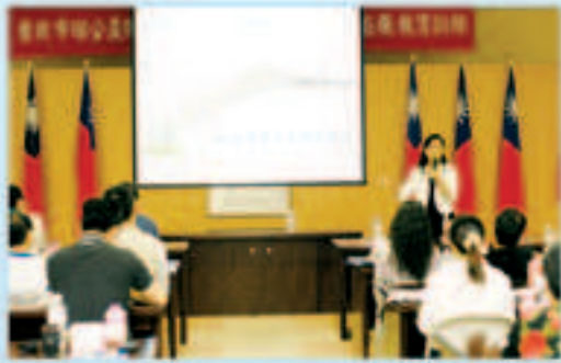
▲辦理98年度第一次員工在職訓練