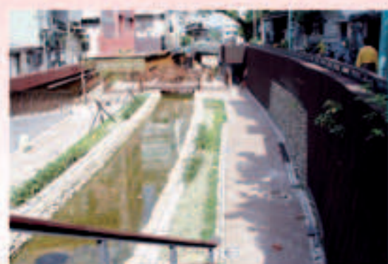
▲現階段施工改善成果-5

基於上述之開發之理念與經營管理之需求，希望透過空間環境的歷史場所精神的保留來達到瑠公圳存在的歷史價值意義，並透過適度的商業引入能達到環境歷史價值的推廣，亦能永續經營瑠公圳紀念展示館與圳道環境空間維護的目的。