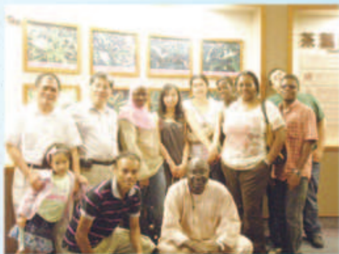
▲本會接待台大農經系博碩士班外籍學生參觀坪林旱作灌溉與茶葉博物館

母國農業，本會不但協助政府使友邦人士見證到台灣農作灌溉的先進技術與農村榮華，也成功的做了一次國民外交工作。