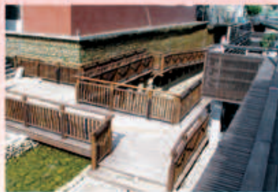
▲現階段施工改善成果-1

臺灣生活空間優質再造一直是政府與民間共同努力的目標，本會秉承社會責任，配合臺北縣政府在環境休閒整體優質發展再利用目標上，對瑠公圳源頭沿線實施環境改造並興建親水設施，期能營造優質生活空間並闡揚歷史傳承的精神，延續瑠公與民興利的偉大胸懷。