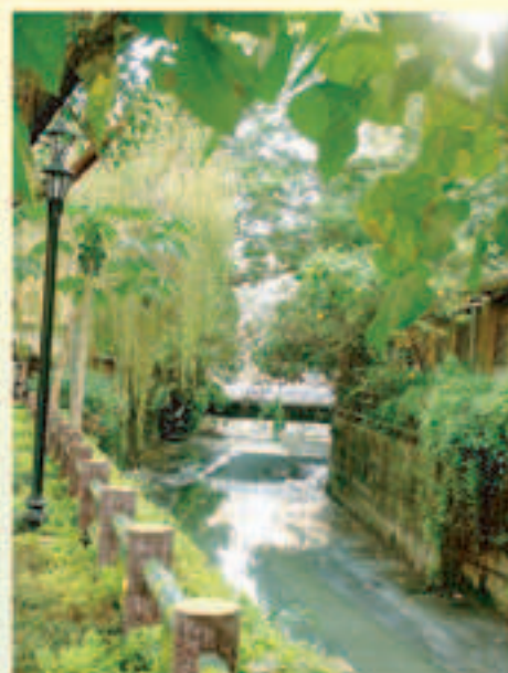
▲本會位於新店市明德新村之原灌溉圳道，現已轉為排水渠運

務委員、小組長及較資深的瑠公主管同仁們的口述，瑠公水利會於臺灣光復後至臺北市改制直轄市前，仍屬農業型態的水利會，農地面積廣大，會員人數上萬人，惟當年向會員徵收的水利會會費（即水租）收入，往往不足以維持會務及灌排管道設施管理之需，常有寅吃卯糧之苦或申請主管機關補助之情況；惟會長及會務主管同仁仍咬