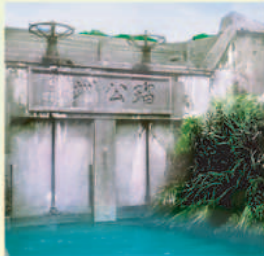
▲早年瑠公圳位於碧潭之取水口

一個民間事業團體，能夠歷經多次的重大組織變革而屹立不搖，的確是一個了不起的團體，近四十多年來歷任會長、總幹事、會員代表，會