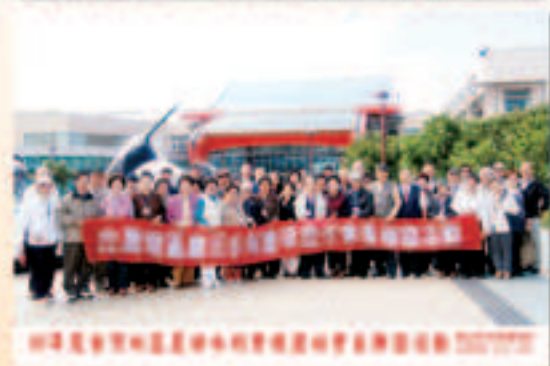
▲96年聯合會同仁合照

項業務研討會，邀請國內外學者、專家傳授各種新穎技術及理念，舉辦各項業務之年度檢討會，藉此交換工作心得，相互切磋以提高行政效率。